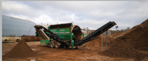
Trakų raj. Žukų kaimas Gruntas, Smėlis 0/4, Smėlis 0/16, Mišinys 0/32, 0/50, Žvirgždas 4/32, 32/50, Augininis.