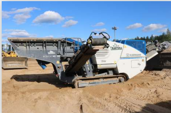
Raudondvaris, Nemenčinė Gruntas, Smėlis 0/4, Smėlis 0/16, Mišinys 0/32, 0/50, Žvirgždas 4/32, 32/50, Augininis.