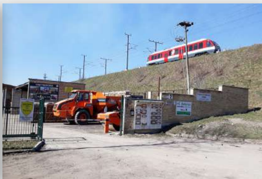
Naujoji Vilnia, Šiaurės g. 2