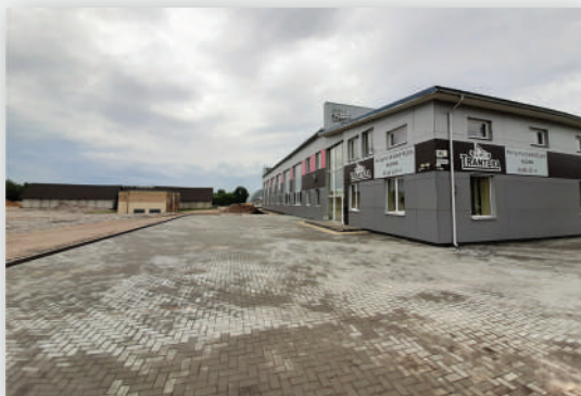
Salininkai, Pupinės g. 1B